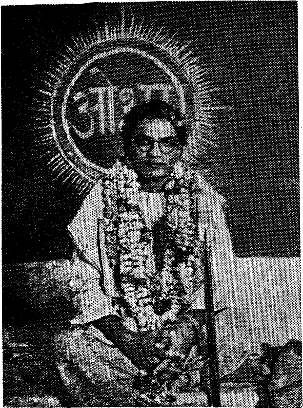
పం. జి. త. నా. ప. యా. పా.